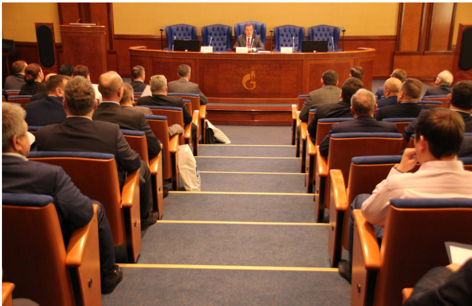
Центральный Совет «Газпром профсоюза»

• дополнительные потери рабочего времени (для пожилых работников в