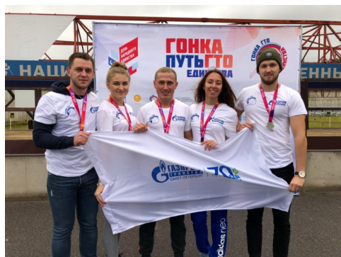
«Гонка ГТО. Путь единства»

Людмила ШЕКЕРА lsheker@spb.lt.gazprom.ru