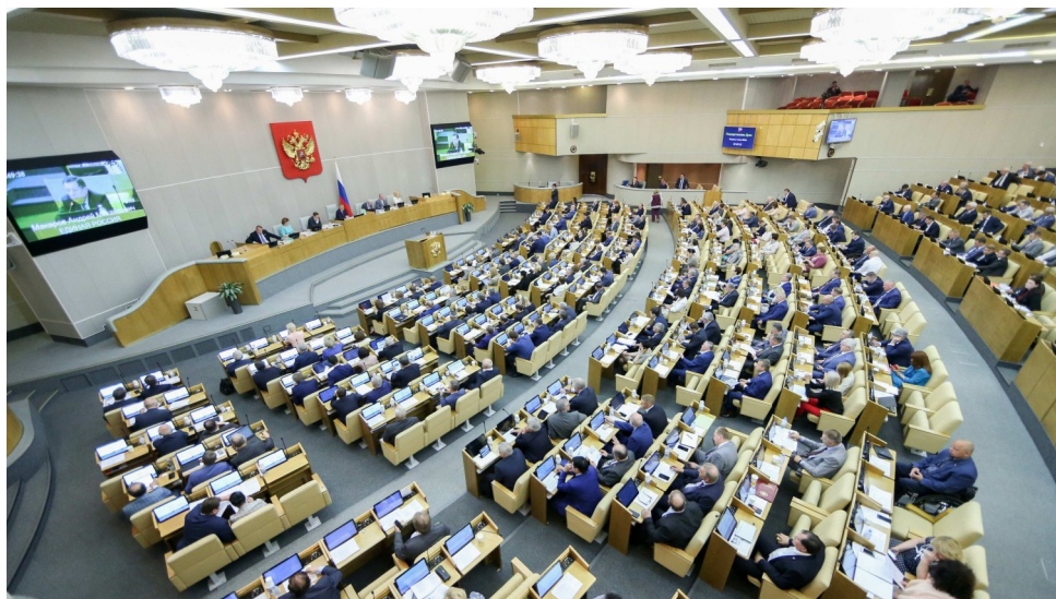
Заседание Государственной Думы по пенсионной реформе

Б езусловно, одной из главных тем ушедшего 2018 года для жителей нашей страны стала пенсионная реформа. Напомним, Государственная Дума России приняла на пленарном заседании 26 сентября во втором чтении и 27 сентября в третьем чтении законопроект Правительства России «О внесении изменений в отдельные законодательные акты Российской Федерации по вопросам назначения и выплаты пенсий», увеличивающий сроки выхода на пенсию для женщин в 60 лет, а для мужчин — в 65.