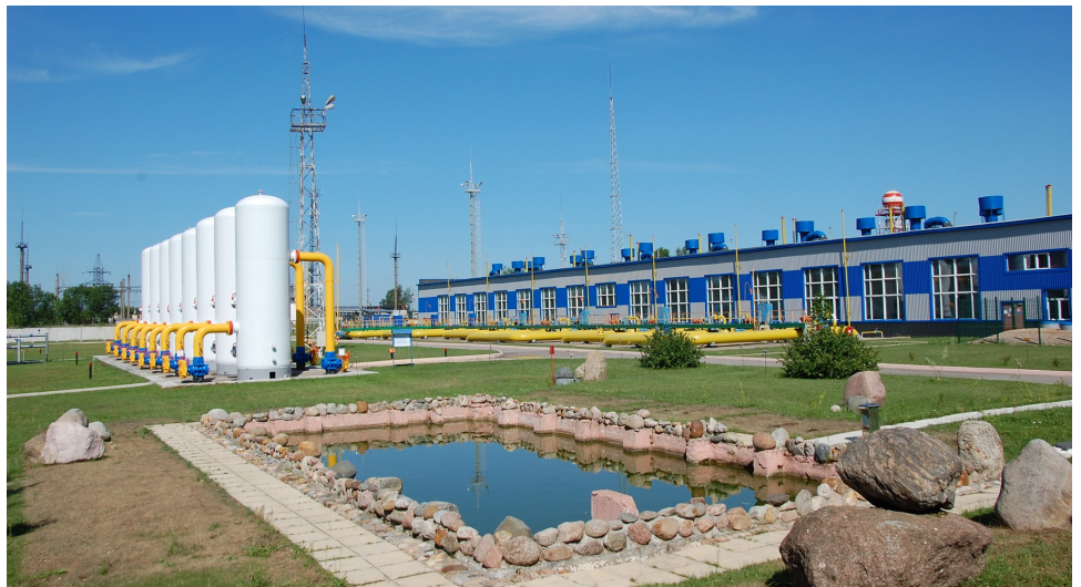
Территория компрессорной станции «Валдайская»

уполномоченные по охране труда, это замечание записываем. Еще реальный пример: допустим, для нормальной работы людям не хватает объема помещения, в небольшом помещении сидят 10 человек. У нас было такое, внесли замечание, после чего уже руководство начало работать. Через некоторое время служба ЛЭС переехала из одного загруженного кабинета в два, людям стало комфортнее работать. Далее – из плохонькой раздевалки переехали в современную раздевалку. Это администрация сделала хозяйственным способом, но с чего-то надо было начинать. Заметьте, все это началось с замечания уполномоченных по охране труда. Плюс «на пять» отработала администрация, директор, заместитель директора. За последние годы мы эту работу просто «поставили на рельсы», систематизировали, сделали серьезней.