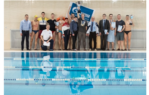
Участники соревнований по плаванию