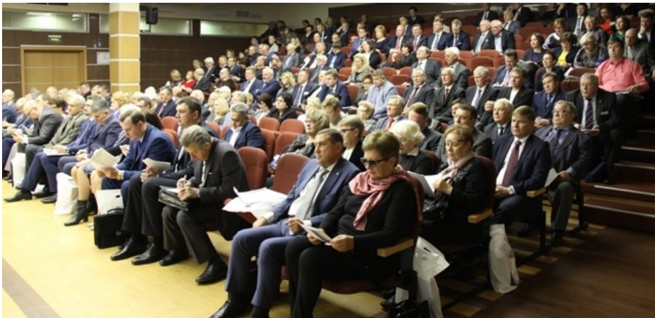
Заседание Генерального Совета Федерации Независимых Профсоюзов России

• опережающее (до окончательного определения периода, с которого внедряются новые подходы в части пенсионного возраста) создание реальных (а не в проектах) рабочих мест, в том числе на новых производствах;