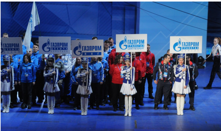
Торжественное открытие XII зимней Спартакиады

Результаты команды ООО «Газпром трансгаз Санкт-Петербург» по видам спорта: пулевая стрельба — 11 место, мини-футбол — 16 место, баскетбол — 18 место, лыжные гонки — 19 место как среди мужчин, так и среди женщин, настольный теннис — 19 место. Общекандный результат — 21 место.