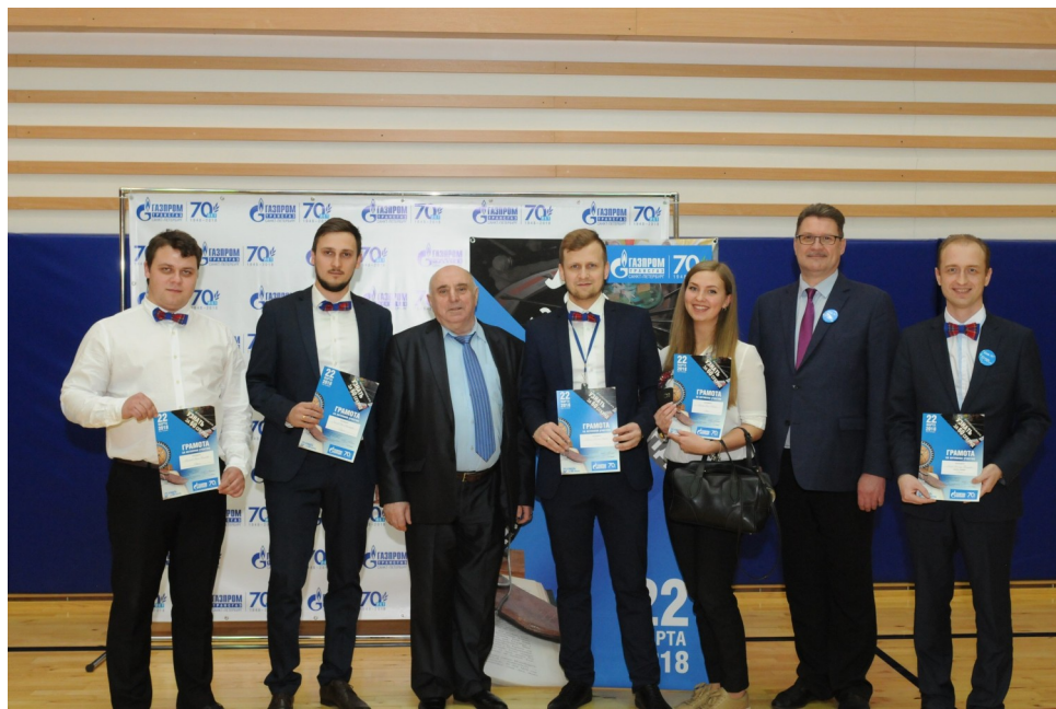
Корпоративная игра «Узнать за 60 секунд»

В 2015 году в нашем Обществе появилась группа молодых и активных людей, которые объединились и создали Молодежный совет при поддержке Профсоюза. Молодые работники — это инициативная, энергичная группа членов Общества, которая составляет почти половину сотрудников компании. Профсоюз всегда видел в молодежи перспективу, и поэтому ведет активную работу, направленную на развитие корпоративной культуры, реализацию инициатив подрастающего поколения.